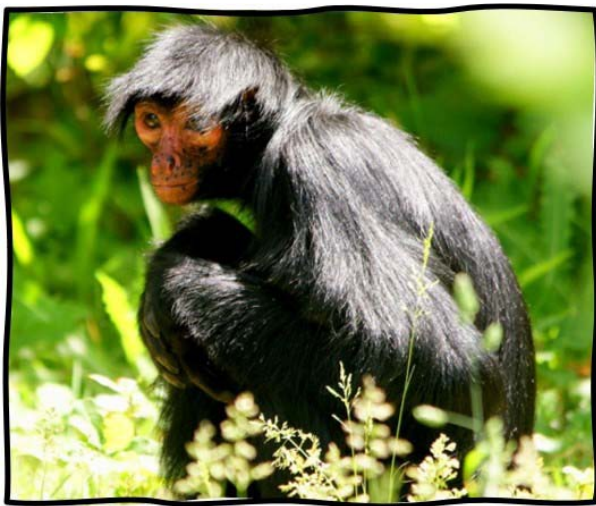
Scimmia ragno Ateles fusciceps, Ateles hybridus, e Ateles paniscus